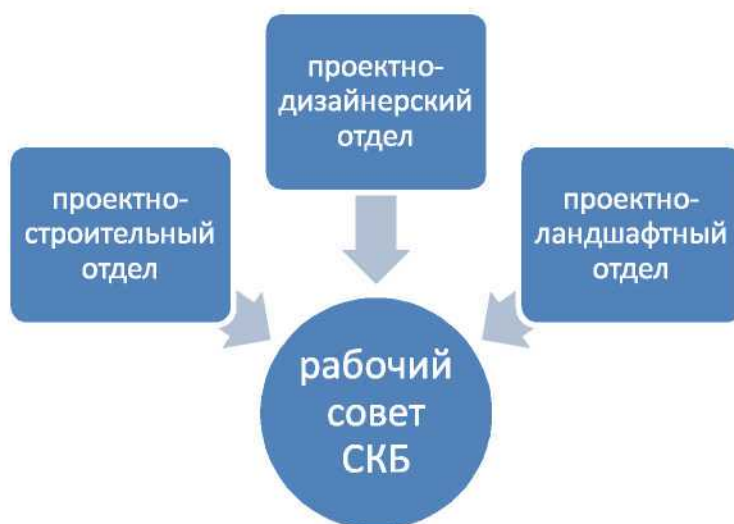
Рис. 4. Структура студенческого конструкторского бюро.

Студенческое конструкторское бюро (СКБ) «Студ-проект НТ» является научно-исследовательским объединением студентов колледжа. Оно создается для содействия в разработке конструкторских и дизайнерских проектов строительных объектов, проектов благоустройства и озеленения городских территорий, в проведении научно-исследовательских и практических работ с возможностью внедрения результатов научно-технической деятельности в производство (рис.4).